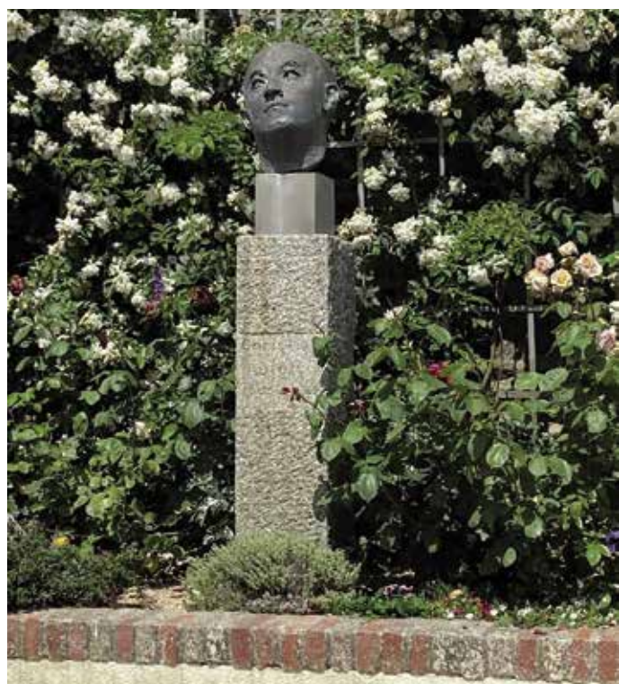
Jardin de Christian DIOR, 19 juin